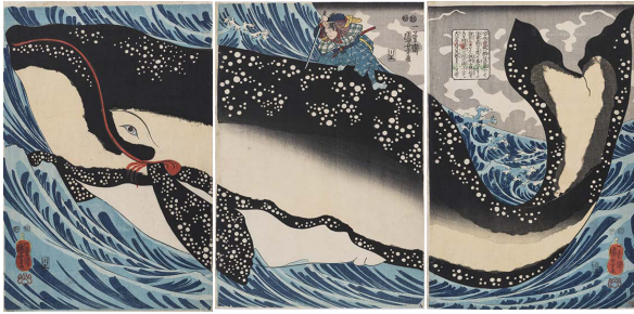
◀宮本武蔵の鯨退治>弘化4年(1847)頃、個人蔵〔通期展示〕