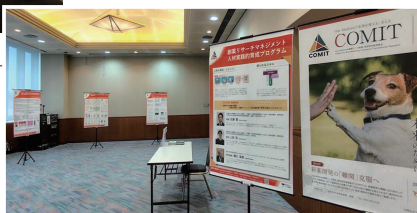
令和7年度創薬共同研究助成採択者による ポスターセッション会場

点(COMIT)が3月13日、最先端の再生医療研究を紹介するシンポジウムをじゅうろくプラザで開催した。 COMITは「One Medicine: ヒトと動物の疾病は共通」との視座の下、「Sharing Medicine(人獣共通医療学)」という新しい学術領域の開拓し、ヒトと動物の創薬研究を加速する拠点として2023年4